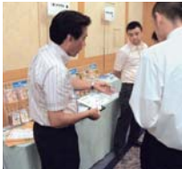
賛助会員のPRコーナー